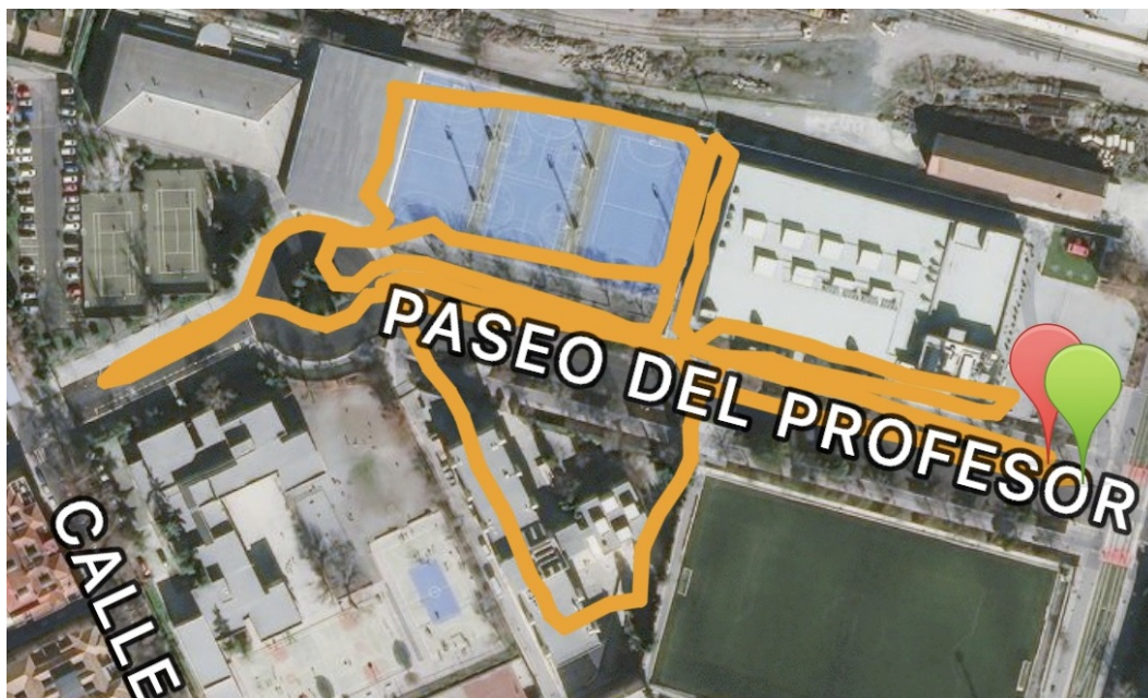
Circuito SUB-14 (1500 m)