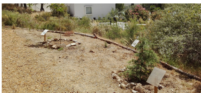
Actividad de reforestación