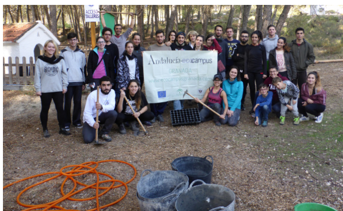
Grupo en una actividad ambiental