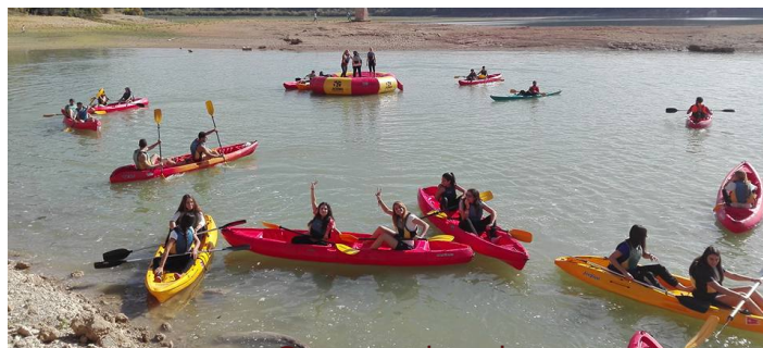
Grupo en kayak

Estos paquetes incluyen una gran variedad de actividades dependiendo del número de asistentes y del tiempo disponible para la actividad y siempre previa reserva o inscripción.