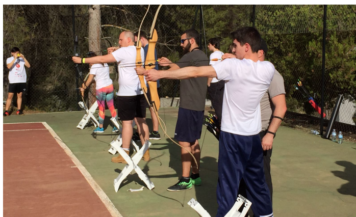
Tiro con arco