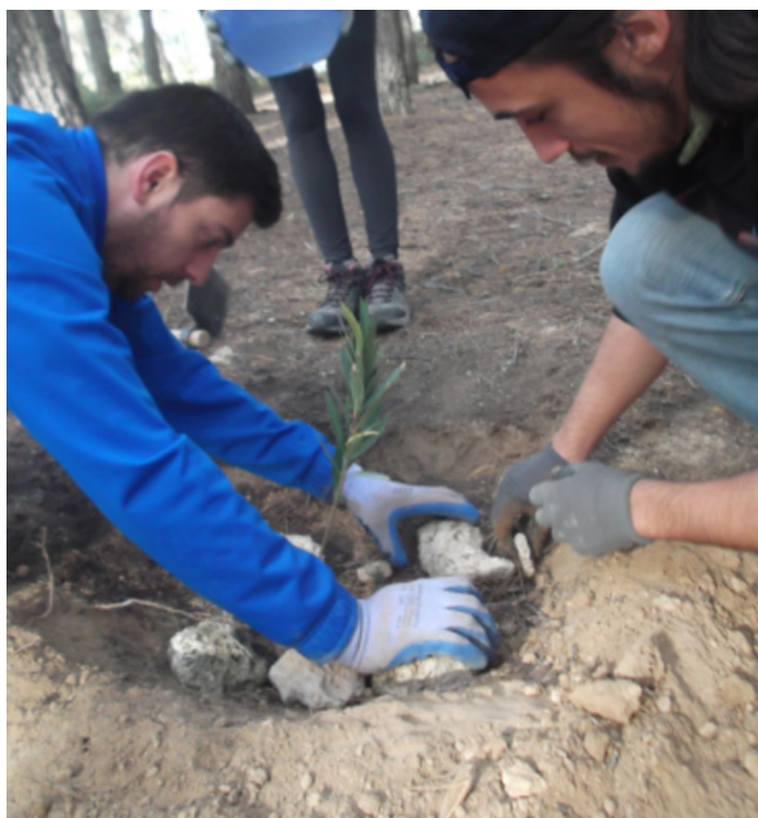
Actividad de reforestación